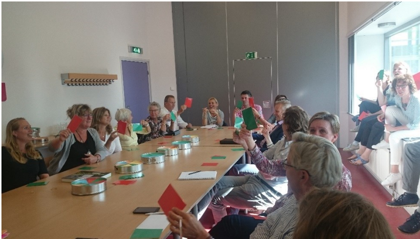
... Verschillen van mening... Rode kaart of groene kaart?

Het waren in de ogen van de deelnemers plezierige bijeenkomsten, waarin mensen met verschillende achtergronden met elkaar in discussie konden gaan over relevante thema's. De werkvormen met kaarten en taarten gaf een ieder de gelegenheid om kennis te nemen van elkaars belangen én van de verschillende meningen, die er gelukkig ook waren.